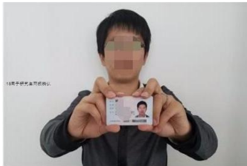
(手持身份证照样例)

2.本人手持身份证照。仅支持 jpg 或 jpeg 格式，大小不超过 10M；拍摄时，手持本人身份证（ 身份证头像照片一面面向镜头 ），将持证的手臂和上半身整个拍进照片，头部和肩部要端正，头发不得遮挡五官或造成阴影； 确保脸部及身份证上的所有信息清晰可见、完整，身份证信息不能被遮挡、不能出现镜像相反文字。