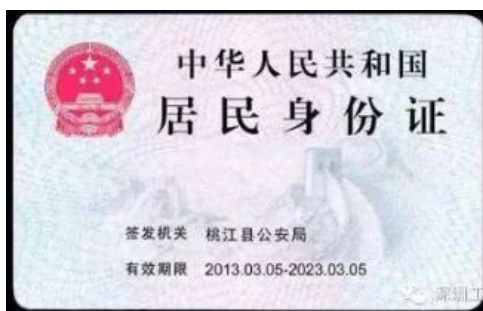
《身份证》正反面样例

以上三项为所有考生均必须上传 ，特别提醒：证件照片要按照上述要求上传，严禁对照片进行修图。如证件照网上审核未通过的考生，须等待通知到现场进行审核，现场审核通过后再进行网上提交。